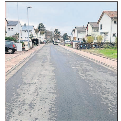
Die Julius-Leber-Straße in Budenheim.

unfair. Sie führen, wie wir aktuell wieder erfahren, zu Unverständnis bei den Bürgerinnen und Bürgern und zu Ärger zwischen Verwaltungen und Eigentümerinnen und Eigentümern. Alle anderen Bundesländer schaffen es das Problem zu lösen und trotzdem werden dort Straßen saniert. Nur in Rheinland-Pfalz soll das nicht möglich sein. Das ist ein Armutszeugnis“, schließt Hoffmann ab.