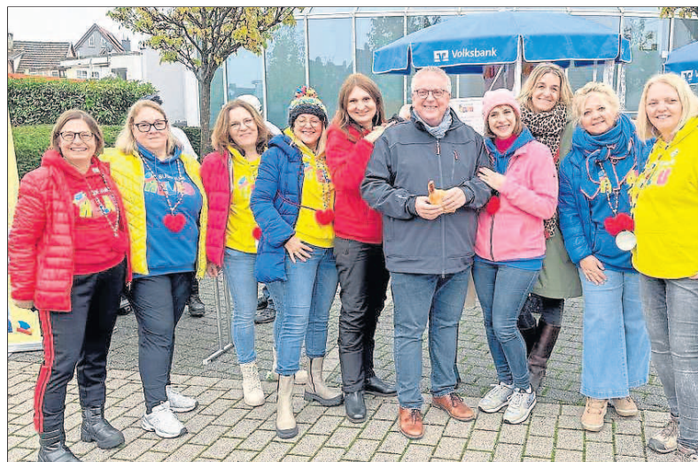
Die Schnorrer-Frauen begrüßten den Bürgermeister auf dem Wochenmarkt.