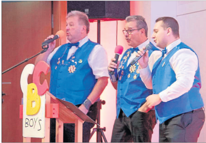
Die CCB-Boys präsentierten ihr Jubiläumslied.

Als das Wahlergebnis verkündet wurde, kam es zu Tumulten, der spontanen Gründung einer Bürgerinitiative und der Androhung von Leserbriefen im Ortsblatt. Eine sofortige Prüfung des Ergebnisses führte zu der Feststellung, dass eine Zahl vertauscht wurde. Also zählte das Wahlgremium erneut. Letztlich gab es drei Siegerweine mit der gleichen Stimmzahl. Demokratisch fastnachtlich wurde auf die Stichwahl einvernehmlich verzichtet und alle drei Weine zum Sieger