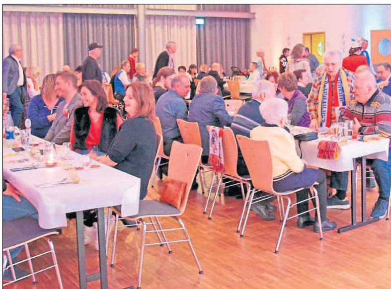
Kampagneneröffnung in fröhlicher Runde.