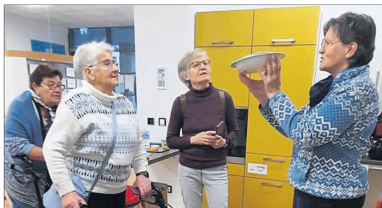
Die fachkompetenten Mitarbeiterinnen erläutern und demonstrieren, wie kleine Alltagshelfer in Bad und Küche das Leben leichter machen.

Auf rund 200 Quadratmetern wurden die Teilnehmenden fachkompetent von den Mitarbeitenden der Beratungsstelle für barrierefreies Wohnen der Stadt Wiesbaden durch die Ausstellung geführt.