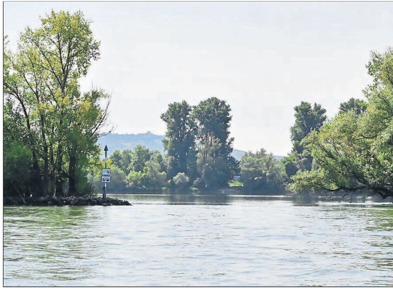
Das NSG „Fulder Aue – Ilmen Aue“ ist seit Jahren Zankapfel zwischen Wassersportlern und Naturschützern. Die zuständige Behörde will nun Kompromisse prüfen.

Denn nur das Stillgewässer der Auen – also ohne gefährliche Strömung und ohne starke Wellen der Berufsschiffahrt auf dem Rhein – machten die sichere Ausbildung und ein störungsfreies Training muskel- und windbetriebener Wassersportarten möglich, argumentiert die Interessengemeinschaft. Dies gelte auch für die DLRG, die