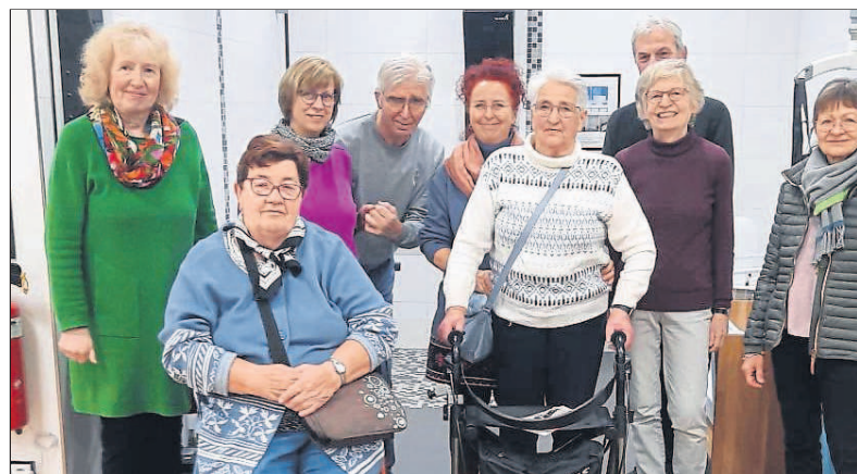
Die Besucherinnen und Besucher der Musterausstellung erhielten hilfreiche Anregungen für das barrierefreie Wohnen und nützliche Hilfsmittel im Haushalt.