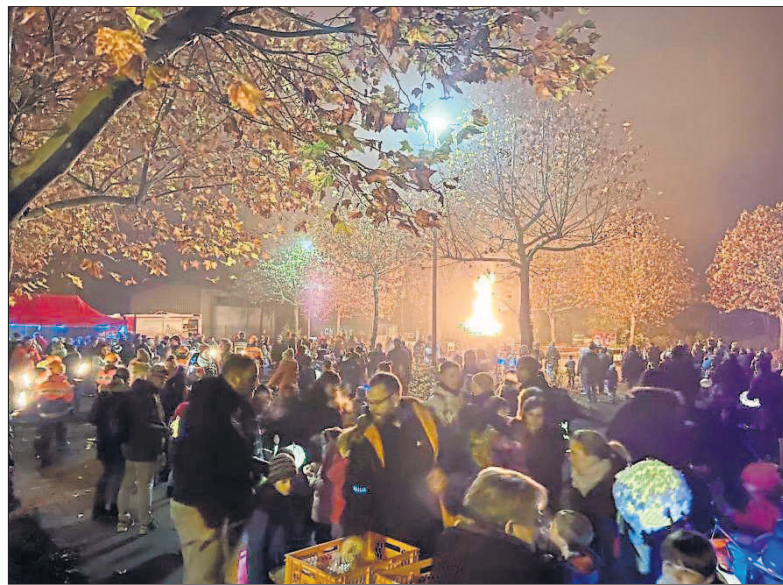
Das beachtliche Martinsfeuer auf dem Parkplatz der Waldsporthalle bot eine stimmungsvolle Kulisse für den Ausklang des Abends.