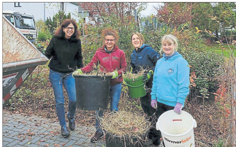
Fleißige Hände und beste Stimmung beim zweiten Arbeitseinsatz der TGM in diesem Jahr.