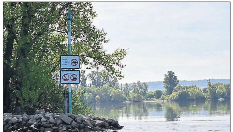
Westliche Einfahrt zum Naturschutzgebiet „Fulder Aue – Ilmen Aue“.

der Vorschlag, engagierte Ehrenamtliche aus den ansässigen Vereinen als „Ranger“ zu benennen. Diese könnten vor Ort als Ansprechpartner und Vermittler zwischen den unterschiedlichen Nutzern dienen und – falls nötig – auch auf Regelverstöße hinweisen. In den Vereinen engagieren sich viele verantwortungsbewusste Menschen, die sich einer solchen Aufgabe sicher gern widmen würden. Aus Sicht der Verwaltung Budenheim ist dies ein positiver Ansatz, den wir ausdrücklich unterstützen. Ein gelungenes Zusammenspiel von Naturschutz und Wassersport in dieser Form sehen wir in Budenheim als wegweisendes Beispiel für das gesamte Rhein-Main-Gebiet.