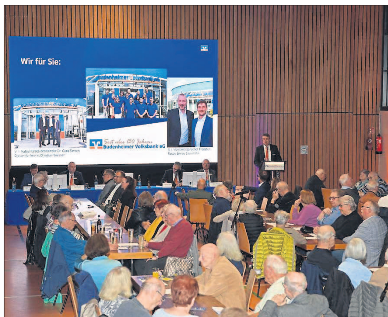
Generalversammlung der Budenheimer Volksbank eG.