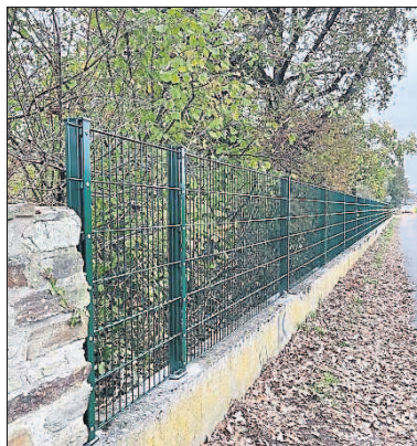
Der Friedhof wurde zum Schutz vor Verwüstungen durch Wildschweine teilweise mit einem Zaun umgeben.

Budenheim. – Die durch Wildschweine verursachten Schäden auf dem Budenheimer Friedhof waren im Frühjahr ein Aufreger und vor allem großes Ärgernis für viele Betroffene. Vieles war über Wochen versucht worden, um die Wildschweine zu vertreiben. Letztendlich erfolglos. Nachdem man dann erst temporär durch Bauzäune Abhilfe schaffen wollte, stimmte der Gemeinderat damals auf Antrag der CDU-Fraktion für eine dauerhafte Umzäunung des Friedhofsgeländes. Diese Umzäunung nimmt nun Gestalt an. Auf der Seite zur Bahn ist bereits ein dauerhafter und sich in das Gesamtbild einfügender Zaun errichtet worden. Richtung Ernst-Ludwig-Straße wurde zudem ein Tor montiert. Weitere Arbeiten sollen zeitnah erfolgen. „Wir freuen uns, dass unser Antrag nun in Teilen in die Tat umgesetzt werden kann und künftig die Angehörigen