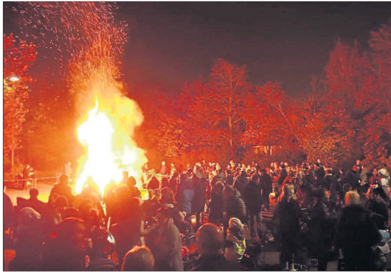
Auch in diesem Jahr wird wieder ein großes Martinsfeuer entzündet.

Der Umzug verläuft durch die Wilhelmstraße, Philipp-Försch-Straße, Luisenstraße, Heidesheimer Straße, Am Reiterweg und die Jahnstraße. „Wir freuen uns, auch dieses Jahr wieder jedem Kinder bei Ankunft am Parkplatz der Waldsporthalle eine kostenlose Mar-