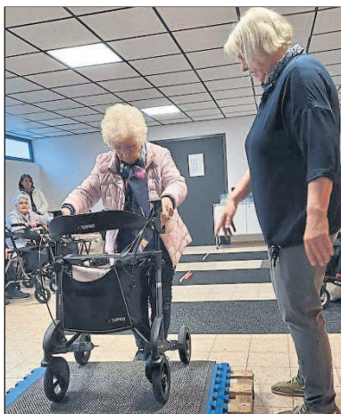
In der Halle der TGM Budenheim wurde unter kundiger Anleitung der sichere Umgang mit dem Rollator geübt.