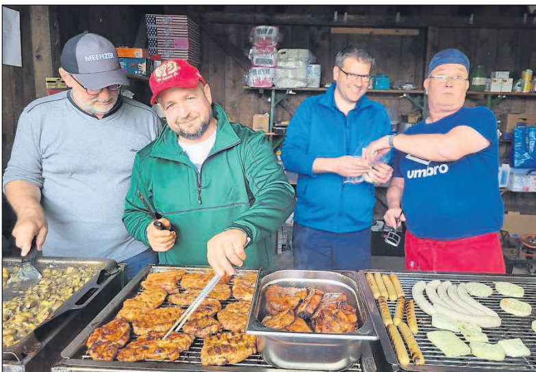
Haute Cuisine beim Väterzelten. Alles mit Begeisterung handgemacht, versteht sich.

Ab 12 Uhr gibt es einen zünftigen Frühschoppen nach bayerischer Art, wozu die Feuerwehr unter anderem ein Weißwurstfrühstück anbietet. Hierzu spielt der „Musikzug Bleidenstadt“ die passende Musik. Gegen 15 klingt die Kerb dann langsam aus.