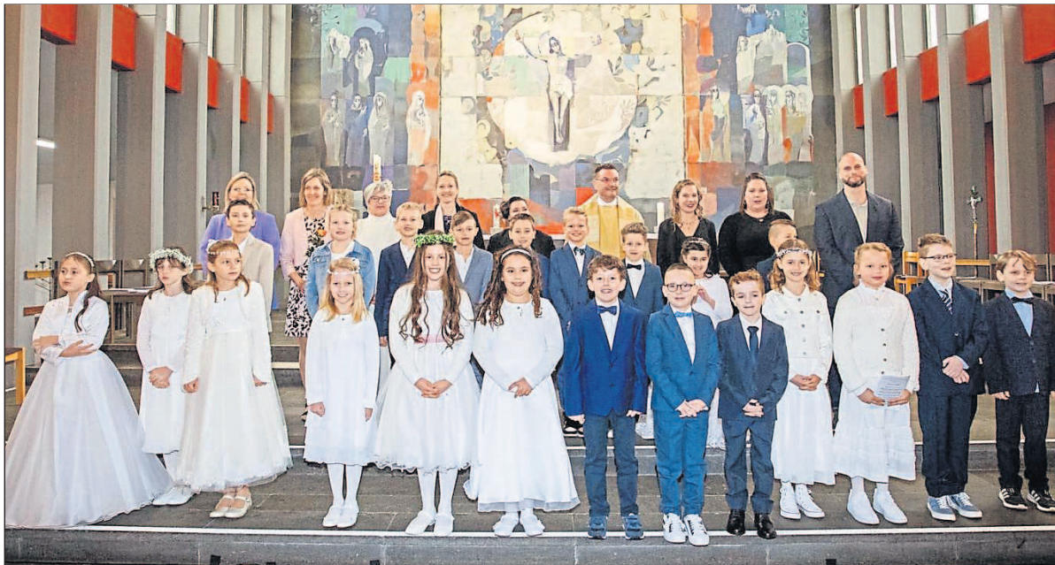
22 Kinder empfangen am vorvergangenen Sonntag ihre Erstkommunion.

22 Kinder empfangen die Erste Hl. Kommunion