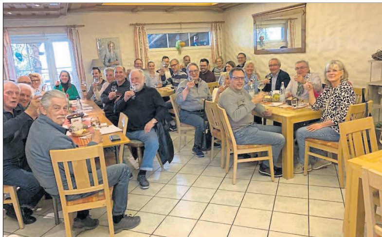
Ein Ausflug zum Weingut Lich bot Gelegenheit zu Geselligkeit und Austausch.