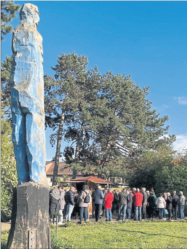
Eröffnung des touristischen Weinstands „Tassilo“ am Rheinradweg.

Budenheim. Der Start ist geglückt. Beim Saisonauftakt des „Tassilo an der Jungau“ herrschte reger Betrieb. Bereits kurz vor der Eröffnung sammelten sich die ersten Gäste an dem neuen touristischen Weinstand am Rhein.