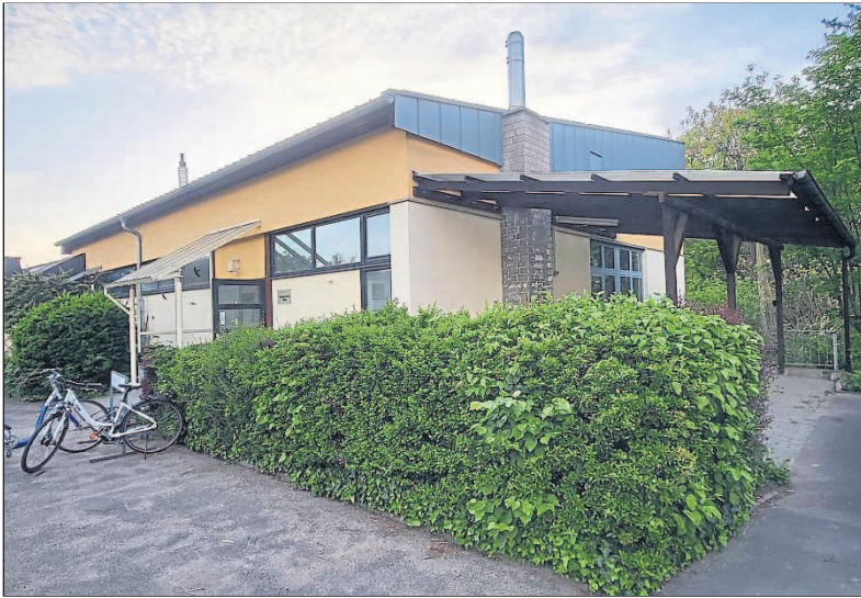
Das Margot-Försch-Haus an der Dreifaltigkeitskirche der Pfarrei St. Pankratius in Budenheim.

Was das Margot-Försch-Haus und die Sixtinische Kapelle gemein haben