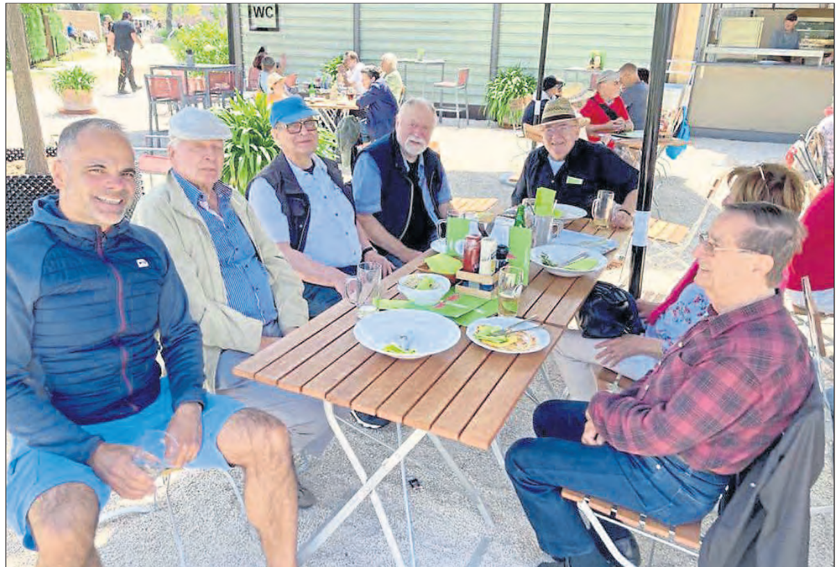
Sieben Mitglieder der Budenheimer Senioren Union waren zu Besuch auf dem Buga-Gelände in Mannheim.

Der Jahrgang trifft sich am Mittwoch, dem 28. Juni, mit Partner, um 17 Uhr im Gasthaus „Zum Goldenen Ritter“, zum monatlichen Treffen.