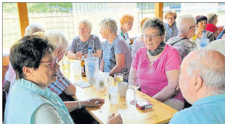
Mitglieder und Gäste ließen es sich beim VdK-Grillfest gut gehen.

Kaum, dass das Buffet fertig war, erschienen die beiden Grillmeister