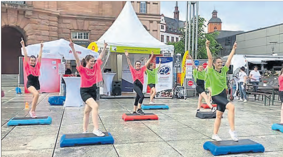
Ein Auftritt der „Stepping Queens“ beim Rheinland-Pfalz Tag 2022.