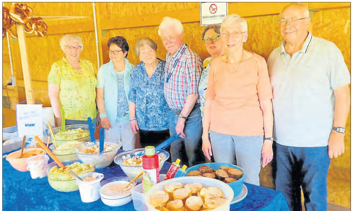
Gute zehn Sorten Salate, Grillsoßen, Spundekäs, Tsatsiki und frische Brezel standen zum Verzehr bereit.

Auch waren die Getränke eiskühlt und reichlich vorhanden. Die Frauen vom VdK-Vorstand konnten sich ganz auf das Bestücken des