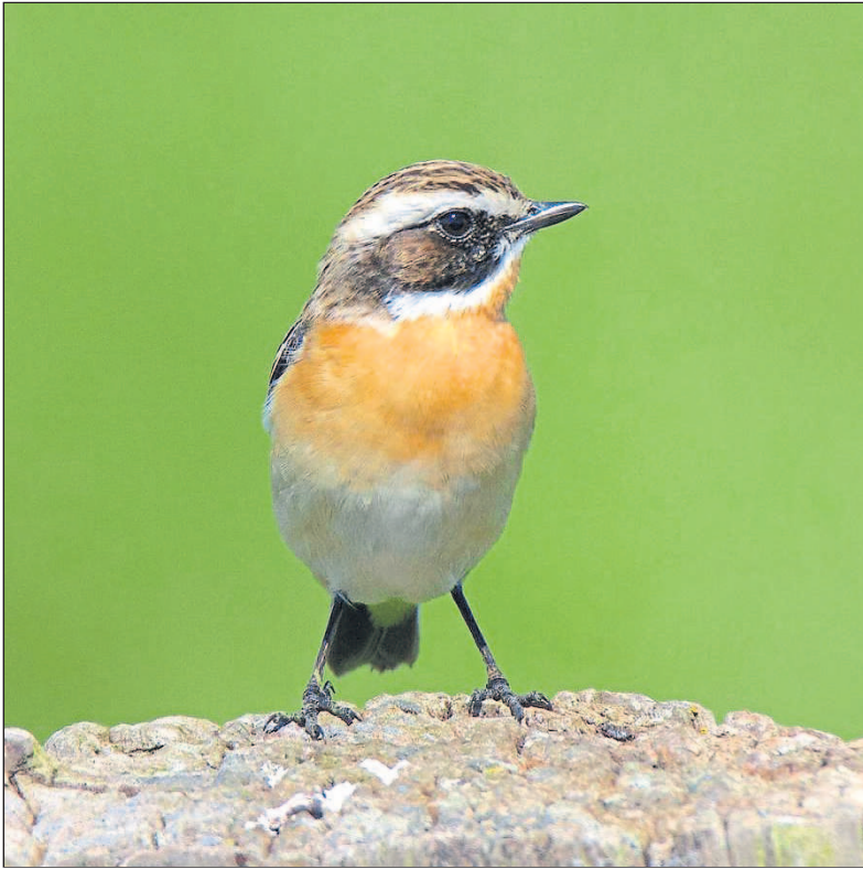
Braunkehlchen ist Vogel des Jahres 2023.

NABU: Fast 135.000 Menschen haben bei der dritten öffentlichen Wahl mitgemacht