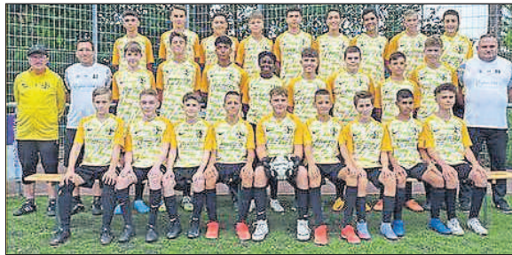
Die C-Jugend des FV Budenheim.

Mombach 03 – FV Budenheim 2:4; FV Budenheim – TSG Draids 2:4; Gensingen/Grolsheim – FV Budenheim 5:1; FV Budenheim – Schwabenheim 2:0 (1. Pokalrunde); FV Budenheim – Jugenheim/RTH JSG 7:4; Schwabenheim – FV Budenheim 0:4; FV Budenheim – Frei-Weinheim/Gau-Algesheim 8:0.