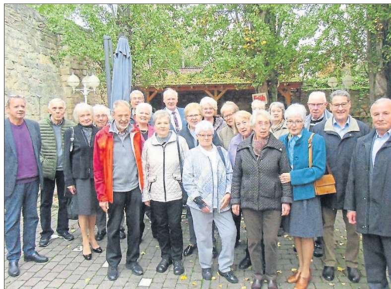
Die Teilnehmer im Hof des Kirchgartens.

im Restaurant „Zur guten Quelle“. Die Abendveranstaltung fand am 19. Oktober im „Landgasthof Kirchgarten“ in Wackernheim statt. Zuvor hatte sich die Jahrgangsmitglieder auf dem Budenheimer Friedhof getroffen, um den 18 Verstorbenen mit einem Erinnerungs-