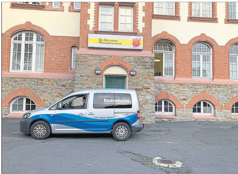
Das Fahrzeug der Gemeindewerke Budenheim vor der neuen Unterkunft.

Budenheim. Für etwa zwei Wochen gehörte er zum Bild des Isola-della-Scala Platzes. Ein ehemals in Budenheim bekannter Bürger lebte seit einiger Zeit obdachlos am Rheinufer. Die zahlreichen Hilfsangebote aus der Bevölkerung und von den Gemeindefunktionären schlug er zu Beginn aus. In den letzten Tagen, bei zunehmend kühlen Temperaturen in der Nacht, häuften sich aber die Sorgen der Bürgerinnen und Bürger und auch der Betroffene zeigt sich jetzt offen für die angebotene Hilfe.