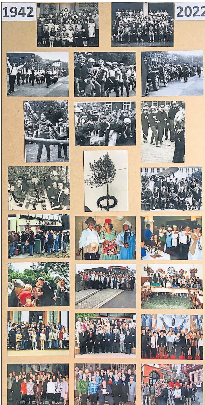
Bildertafel der Aktivitäten.