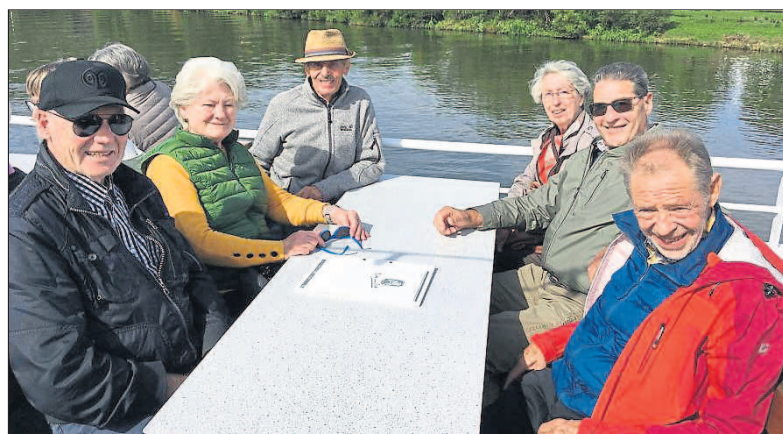
Ausflug auf der Mosel.