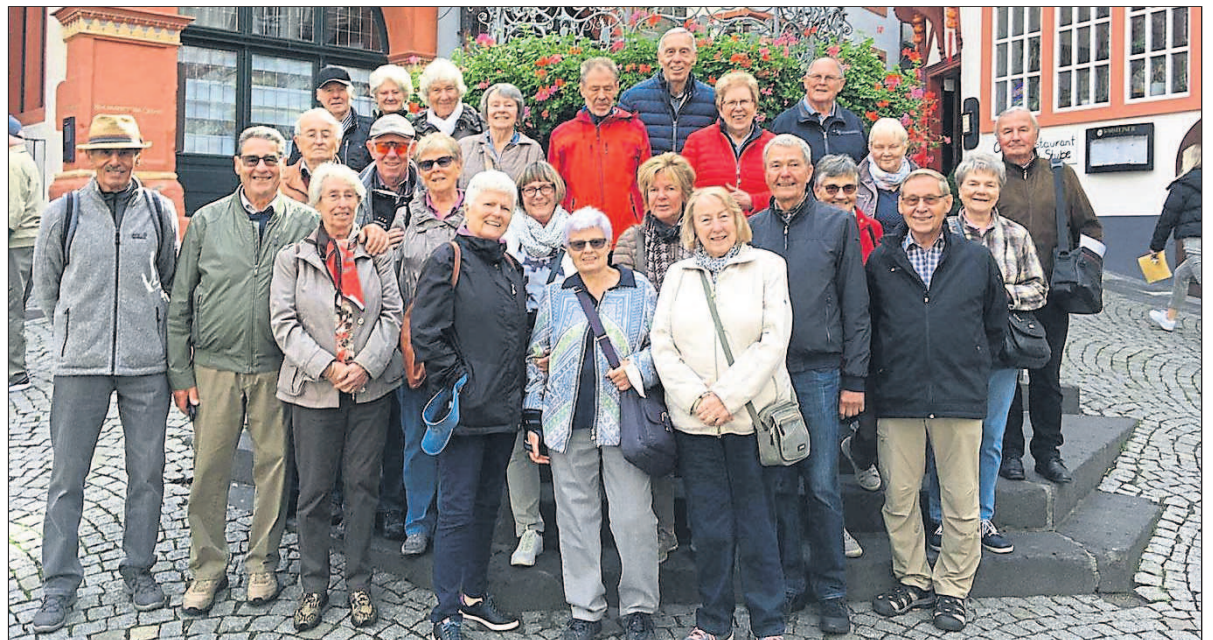
Die Teilnehmer des Ausflugs bei der Stadtführung in Bernkastel.

Budenheim. Die Jahrgangsmittglieder feiern in diesem Jahr ihren 80. Geburtstag und sie nahmen das 60. Jubiläum des Jahrgangs zum Anlass, sich wieder Mal zu einem Ausflug zu treffen und danach einen Abend in geselliger Runde zu begeben. Der Ausflug führte 25