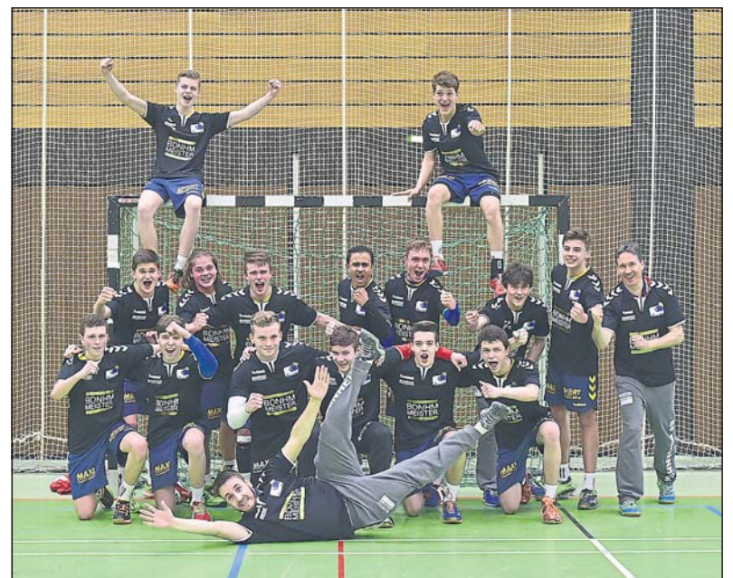
Nach dem Abpfiff brachen alle Dämme: Die Oberligameister der männlichen B-Jugend kommen aus Budenheim.