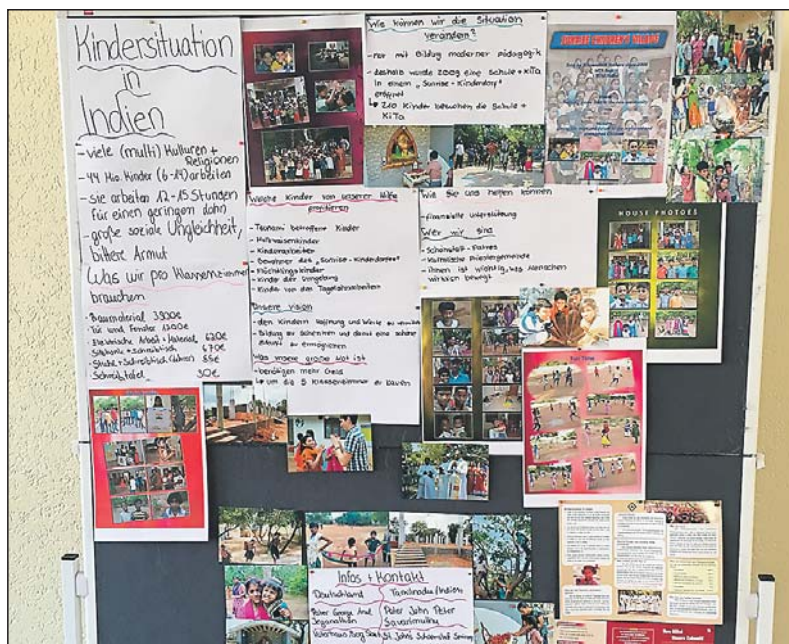
Infotafel zum Projekt „Sunrise Schule“ in Indien.