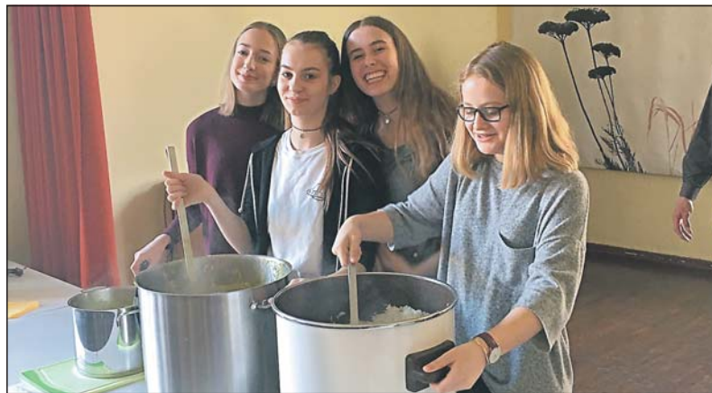
Firmlinge bei der Essensausgabe.

als Kaplan tätig war, ist im Süden Indiens im „Sunrise Kinderdorf“ tätig, das von den Schönstatt-Patres getragen wird. Dort wird eine Schule gebaut, die verwaisten und verlassenen Kindern mit dem Einsatz moderner Pädagogik wieder Hoffnung geben und Werte vermitteln will. Der Bau dieser Schule kann nun aus Budenheim mit 1.000 Euro unterstützt werden: Am Sonntag kamen dank großzügiger Spenden 630 Euro zusammen, die Differenz wurde mit Mitteln aus den monatlichen Türkollekten aufgestockt. Die Vorbereitung des Essens wurde tatkräftig von einigen Firmlingen unterstützt, die nicht nur das Schnippeln und Kochen, sondern auch die thematische Gestaltung einer Pinnwand übernommen hatten. Der Missionskreis der Katholischen Pfarrgemeinde lädt zweimal im Jahr zu einem Essen zugunsten der Weltmission ein.