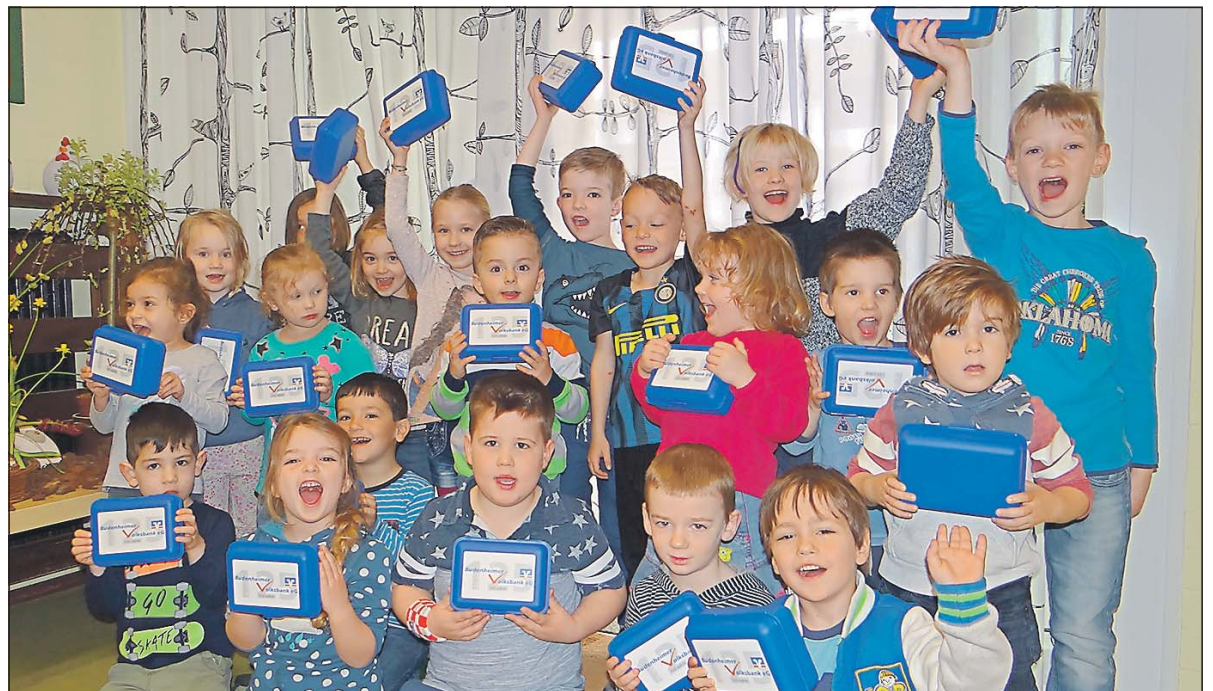
Große Freude der Kleinen des Gemeindekindergartens „Villa Kunterbunt“.

Die Kinder staunten nicht schlecht, dass die Volksbank bereits ihren 125. Geburtstag feiern kann, und freuten sich über die mitgebrachten blauen Brottdosen mit Jubiläumsaufdruck. Am spannendsten war natürlich die kleine Überraschung, die in jeder Brottdose darauf wartete, entdeckt zu werden. Insgesamt 700 Brottdosen wurden verteilt, in denen die Kinder jetzt täglich ihr Frühstück mitnehmen können.