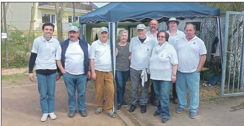
Die Budenheimer Boulisten.