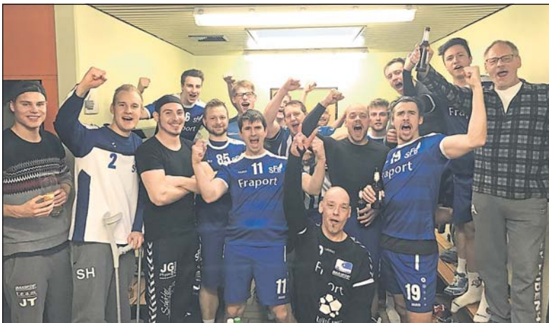
Nun auch rein rechnerisch nicht mehr vom Spitzenplatz zu verdrängen: die Herren III der Sportfreunde Budenheim.