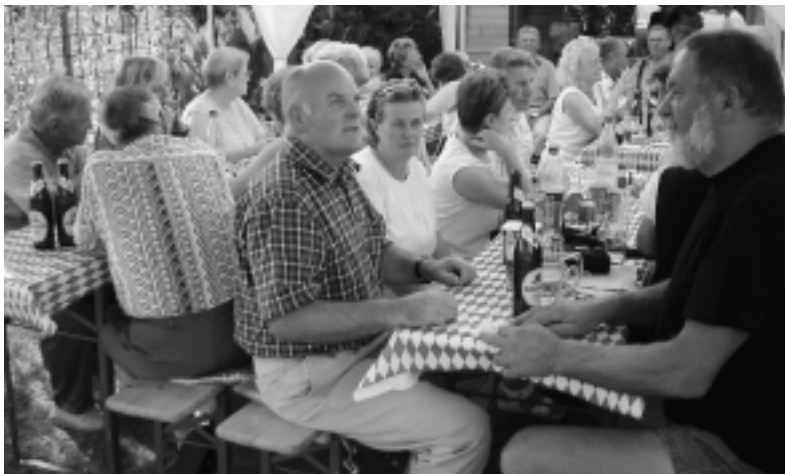
Bei besten Wetterbedingungen wurde gefeiert bis weit nach Mitternacht.

verschiedener hausgemachter Salate sowie des großen Angebots an Getränken konnte jeder Durst und Hunger gestillt werden. Alle waren frohgelaunt, und es wurde viel erzählt und gelacht. Am Ende wurde dem Vorstand allgemein Beifall für den gelungenen Abend, die gute Organisation sowie die umfangreiche Vorbereitungstätigkeit gespendet. Auch der Gastgeber war davon angetan und versprach eine Wiederholung im nächsten Jahr.