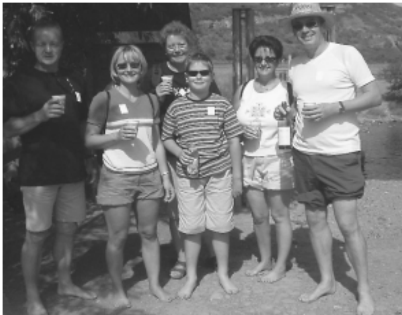
Eine kleine aber feine Gruppe der Tennisfreunde eroberte den Bad Sobernheimer Barfußpfad.

Budenheim. – Am Samstag, 16. August, machte sich eine kleine aber feine Gruppe der Tennis- freunde Budenheim auf nach Bad Sobernheim, um den dortigen Barfußpfad zu erobern.