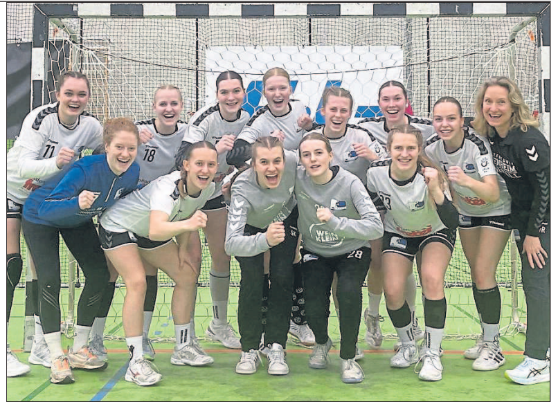
Weibliche A-Jugend: Trostpflaster nach durchwachsender Saison.