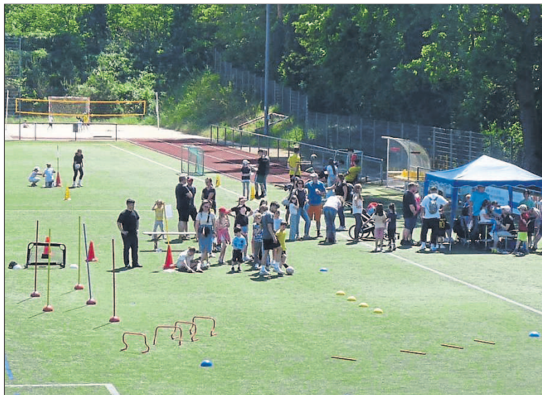
Vielfältige Angebote für Fußballbegeisterte aller Altersstufen.

Eine weitere Besonderheit an diesem Tag war der Auftritt der Zumba