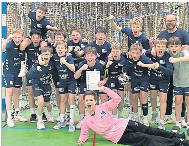
Männliche D-Jugend: Nicht zu (s)toppen!

terschaft in ihrer Staffel der Kreisklasse. In einer anderen Staffel erreichte der jüngere Jahrgang 2012 zusammen mit einigen unterstützenden E-Jugend-Spielerinnen Rang fünf.