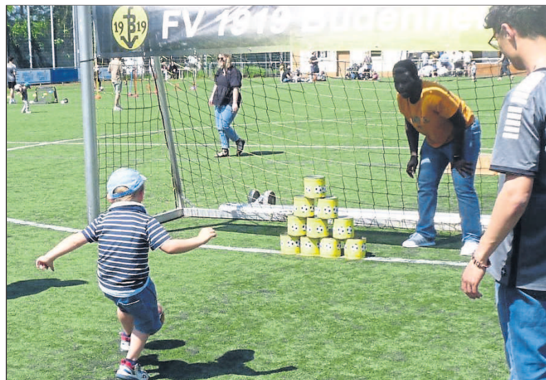
Dosenschießen: jeder Schuss ein Treffer.