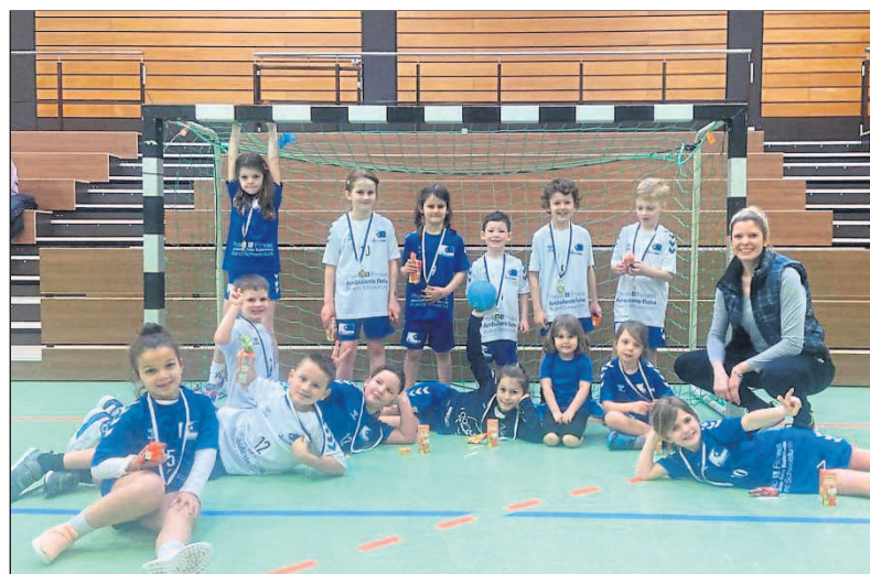
Minis/F-Jugend: Goldmedaillen und Trinkpäckchen.

Zweimal die Woche treffen sich die „Minis“ – Jungs und Mädchen im Alter von etwa fünf bis acht Jahren – in der Waldsporthalle. Sie lernen spielerisch, mit dem Handball umzugehen, wobei der Spaß an erster Stelle steht. Die älteren Minis bilden die F-Jugend, mit der sie als jüngstes Sportfreunde-Team am Liga-Spielbetrieb teilnehmen. Zudem gibt es bei Mini-Turnieren „echte“ Goldmedaillen und Trinkpäckchen abzusuchen.