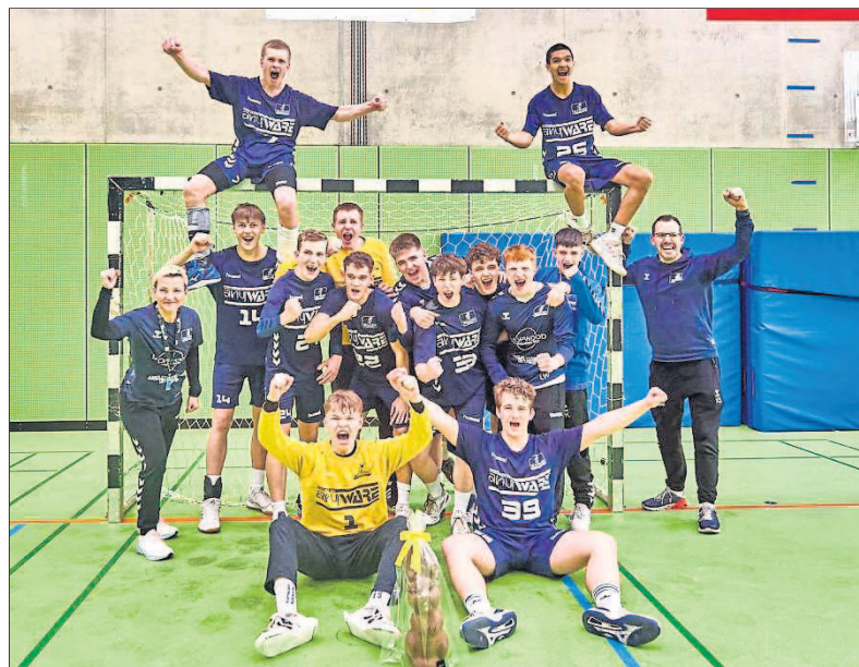
Männliche B-Jugend: Herausragende Leistungen.

Mit einer blütenreinen Weste haben sich die D1- und D2-Jungs der Sportfreunde aus der Saison verabschiedet. Zahlen und Fakten zweier souverän eingefahrenen