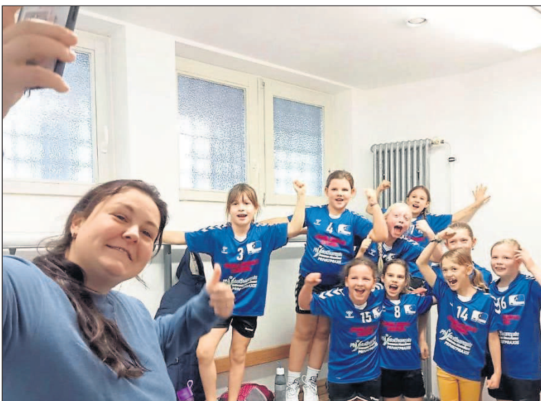
Weibliche E-Jugend: Erlebnis statt Ergebnis.

Die Budenheimer B-Boys (Jahrgänge 2007 und 2008) sind mit zwei Mannschaften in die Saison