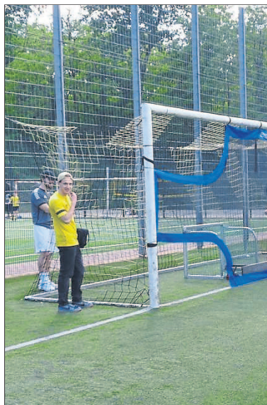
Beim Torwandschießen erproben die künftigen Torschützenkönige ihre Treffsicherheit.

Aufgrund zahlreicher Helfer konnte dieser Tag mal wieder als voller Erfolg (auch finanziell) für die Budenheimer Jugend verbucht werden. – Und wer weiß: Vielleicht bewegt dieser Tag ja den ein oder anderen kleinen Kicker zu einer Mitgliedschaft im Fußballverein.