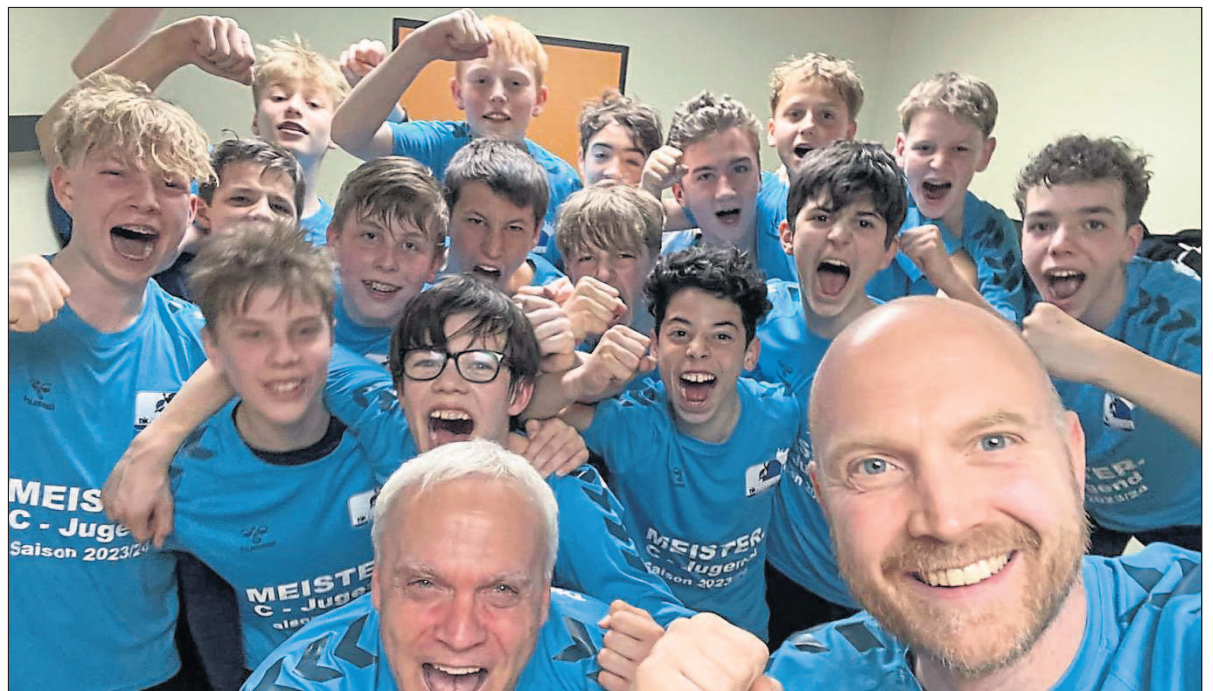
Männliche C-Jugend: Eine Mannschaft – zwei Titel.

Die A-Mädels der Sportfreunde Budenheim sind in dieser Spielzeit erneut nicht nur in der Oberliga RPS, sondern auch in der in Turnierform ausgetragenen Jugendbundesliga Handball (JBLH) angetreten. Dort mussten sie allerdings nach drei Niederlagen in der Gruppenphase früh die Segel streichen.