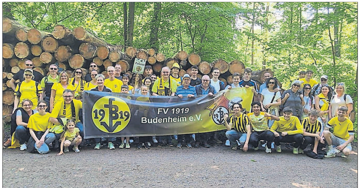
Leidenschaftliche Unterstützung beim Kreispokalfinale durch die Fans des FVB.

Jetzt gilt es, in den letzten drei Heimspielen die Saison versöhnlich abzuschließen. Das nächste Heimspiel findet am 12. Mai um 15 Uhr gegen den FC Basara II statt.