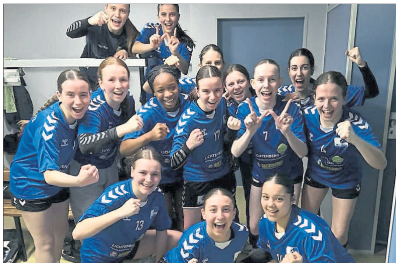
Weibliche B-Jugend: Auf dem Weg nach oben.